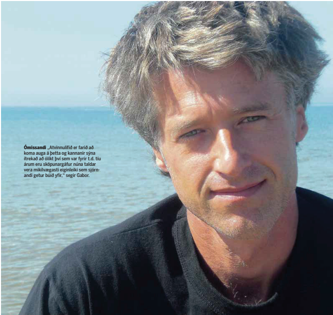
Ómissandi „Ávinnumlítið er farið að koma auga á þetta og kannanir sýna lítekað að öðlit því sem var fyrir í d. tíu árum eru sköpunargáfar mína taldar vera mikilvægir eiginleiki sem sjórændi getur búið yfir,“ segir Gabor.

En er ekki fólk fast í viðjum eigin persónuleika og viðhorfa? Eru ekki sumir að eðlisfari opin og ljúga hugmyndamennti á meðan ávri leyfa ábætunum og eigin hugarfari að talmarkna sig? Gabor segir hægt að koma fólk að útleikna sér þessa nýja hugasun: